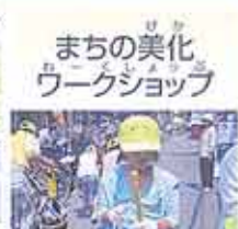
まちの美化 ワークショップ