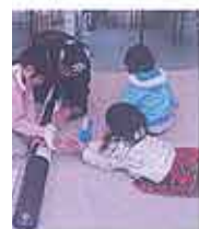
ことで、共生につ もが主役のイベ