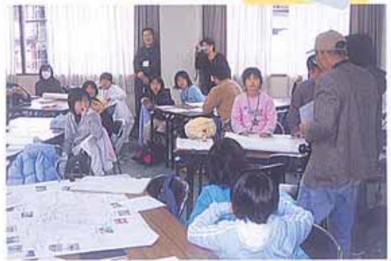
昨年の庄内公民館での様子

子どもたちがテーマに沿って写真を撮ったり、インタビューしたうえで、それをグループでまとめるワークショップです。このような体験を通じ、まちや人の切り取り方や接し方を学ぶとともに、共同作業の中で他の人たちとの考え方の違いや多様性なども学びます。その際におとなたちがいろんな形で関わり、世代をこえた相互の学びあいになります。また、この行事を行うにあたり、いろんな立場の人が企画・実施・協力しますので、ともに思いを実現する経験と関係づくりにつながり、学びの輪が広がっていきます。これまで、野田、克明、刀根山、上新田、庄内公民館、野畑、上野で開催しており、3月2日には、再度庄内公民館で開催します。